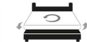
Gire su colchón o voltéelo cada 3 meses Otros Modelos: Uso de ambos lados